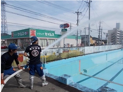
5/15 プール清掃 第6分団の協力