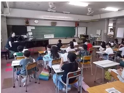
6 / 12 3年：音楽授業