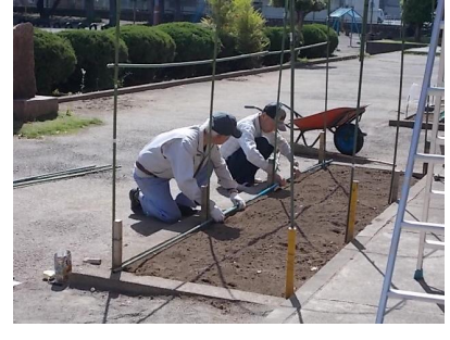
5/10用務員さん花壇作業