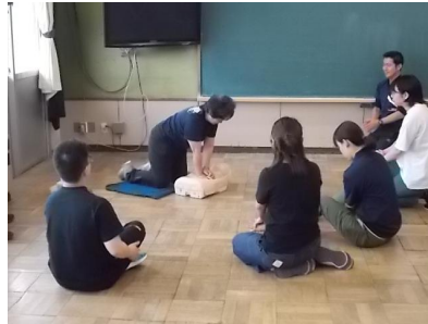
5 / 30 救命救急講習会