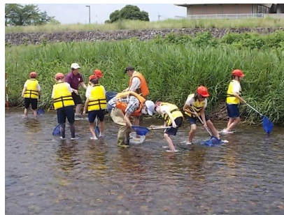
6 / 27 4年：水辺の楽校