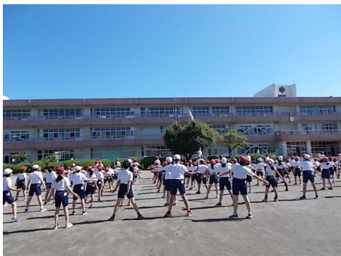
6/19 朝運動(ラジオ体操)