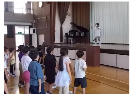
7/5 全校朝会：校歌を歌う

また、各種大会やコンテストで入賞した児童をみんなで称賛することも心温まる瞬間です。最後に、校長から、その時々話題から心掛けてほしいことを伝えます。7月はパリ・オリンピックに関連させ、「過程の大切さ」を話しました。コロナ禍で、みんなが一堂に介することができなかったことを考えると、みんなで直接集まることが出来る時間がとても貴重です。