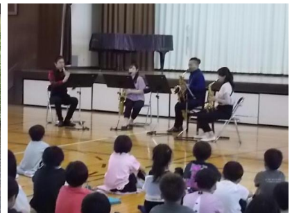
7/12 サックスカルテット