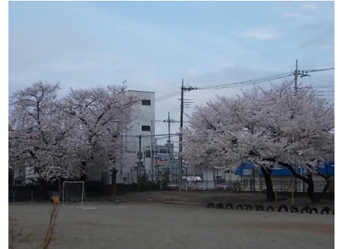
4/7 校庭西側の満開の桜

いよいよ明日からは、8月いっぱいまで44日間の夏休みが始まります。日々の健康に留意しながら、日頃できない活動にも挑戦して、元気な顔で一回り大きく成長した子どもたちに9月2日(月)に会えることを楽しみにしています。