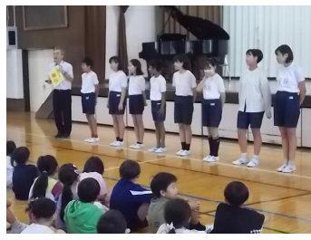
9/28 陸上記録会壮行会