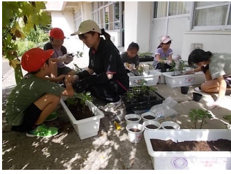
9/10 人権の花 移植作業