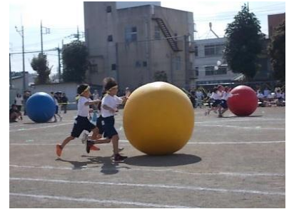
運動会 大玉ころがし

長かった2学期もいよいよ終わりになります。少し2学期を振り返ってみます。9月2日からスタートした2学期は、子ども達の活躍や成長が随所に見られました。5・6年生がたくさん市陸上記録会に参加し、県大会に3名が出場することになりました。また、運動会では、競い合う仲間いることでお互いを高め合う姿がどの学年でも見られ、心を打たれました。修学旅行でも、6年生の自分の役割をしっかりと果たす姿に成長を感じました。さらに、子ども達は休み時間になると、校庭、図書室、音楽室、教室と各所で友達と笑顔で交流できるところがさすが「東っ子」だ感じました。これもご家庭や地域の皆様の温かいご支援ご協力のお陰であり、感謝申し上げます。