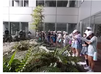
9/20 4年 県庁見学