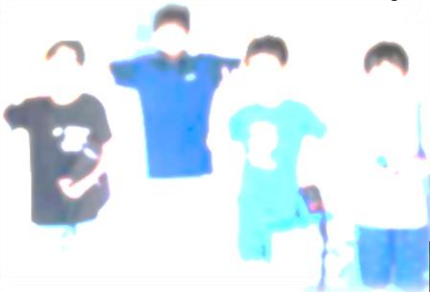
市水泳記録会(7月25日) 県水泳記録会(8月7日)

市水泳記録会に、4人の子どもたちが出場し、勇敢に泳ぎ切りました。とても格好良かったです。県水泳記録会に、桐生市の代表として50m平泳ぎ6年の部で1名出場し、立派に頑張りました。