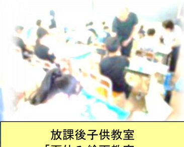
放課後子供教室 「夏休み絵画教室」 (8月1日)

市水泳記録会に、4人の子どもたちが出場し、勇敢に泳ぎ切りました。とても格好良かったです。県水泳記録会に、桐生市の代表として50m平泳ぎ6年の部で1名出場し、立派に頑張りました。