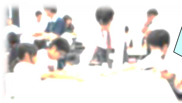
桐生みどり地区いじめ防止フォーラム (8月1日)

同地区の小中高生三十八人が笠懸公民館に集まり、班別協議をしました。「集団の良い雰囲気づくりがいじめ防止につながる」をテーマに、八班に分かれて「良い雰囲気をつくるにはどうしたらよいか」について、話し合いました。話し合った後、班ごとに話し合いの様子を発表しました。詳細については、九月十三日の全校朝会において、参加した児童から全校の子どもたちに伝える予定です。