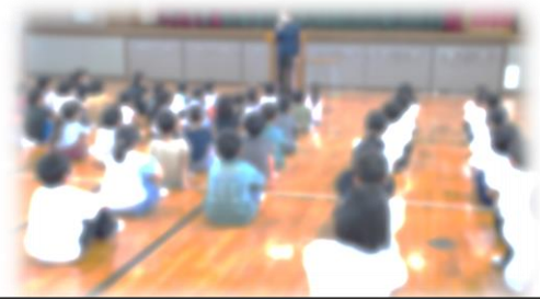
しっかりと前を向き、自分を振り返りながら話を聞いている子どもたち