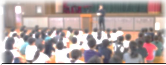
背筋を伸ばして体育主任の話を真剣に聞いている子どもたち