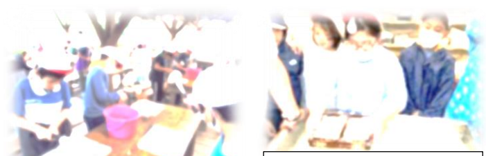
原料のコウゾの皮を叩いている子どもたち

5/28(火)桐生市青少年野外活動センターで、3年生が桐生和紙作りに挑戦しました。「桐生和紙」は、桐生市が誇る伝統工芸品です。子どもたちは、1人2枚はがきを作成し、大喜びしていました。