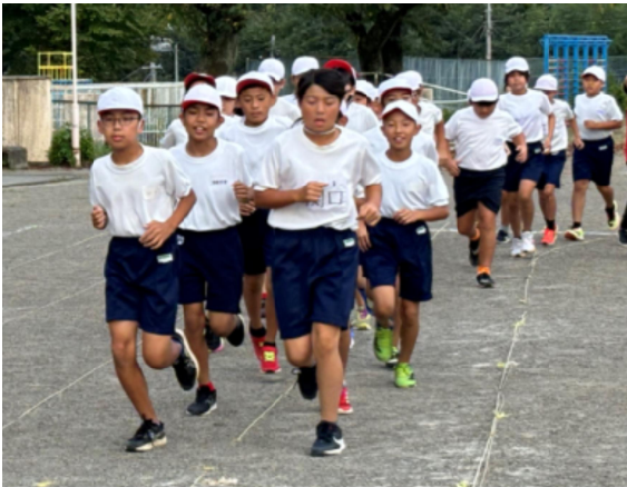
練習に取り組む選手の皆さん

10月3日(木)に桐生市小学校陸上記録会がありました。本校からは5, 6年生の代表児童が参加し、全16種目中の4種目で優勝し、7種目で入賞することができました。(参加校は桐生市内全17校)