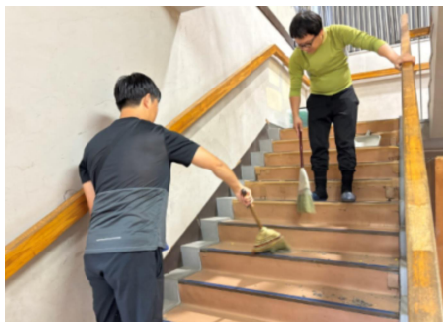
埃だらけの体育館が美しく

9月29日(日)にPTA奉仕作業が行われました。あいにくの雨にもかかわらず当日は70名以上の方が参加してくださいました。当初予定されていた校庭の側溝掃除はできませんでしたが、お父さん方に体育館の掃除をしていただいたところ大変きれいになりました。また、お母さん方や子どもたちにやっていただいた玄関や廊下の窓もピカピカになりました。大変ありがとうございました。