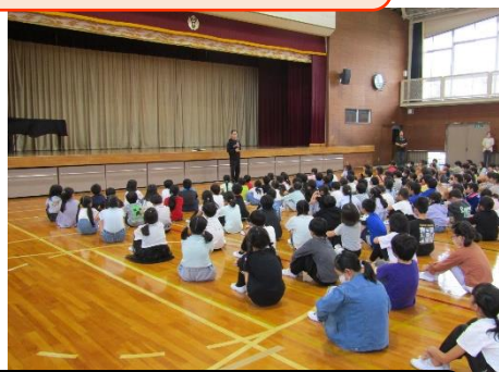
避難訓練 不審者対応訓練