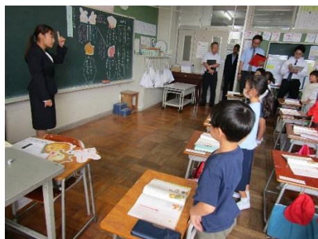
指導主事訪問での研究授業（1の2）