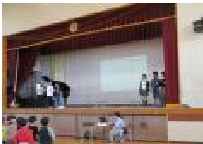
<集会委員児童による進行>

JRC（青少年赤十字）は学校生活の中で「気付き、考え、行動する」という態度を養い、奉仕の精神を学ぶ活動です。登録式は、毎年この時期に全校児童が青少年赤十字のメンバーとして赤十字の取組やねらいについて理解し自覚をもって活動することを確認するために行われます。