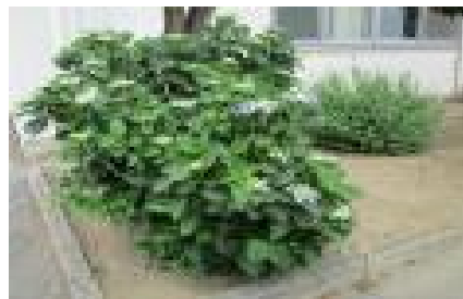
<見頃を迎える校舎前のおじさい>

児童が安全にそして安心して学習に取り組めるよう、職員一同努めてまいります。保護者の皆様におかれましては、お子様の健康管理等でお世話になりますが、どうぞよろしくお願いいたします。