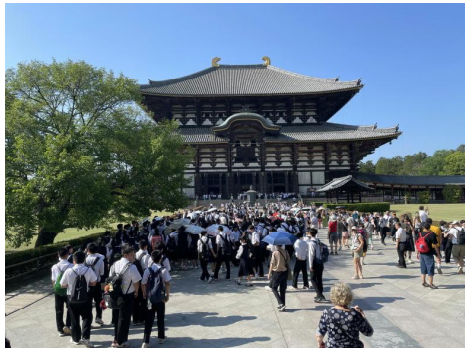
1日目 東大寺大仏殿