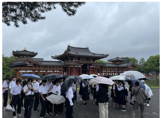
3日目 平等院鳳凰堂(阿弥陀堂)