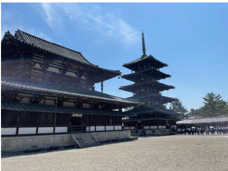
1日目 法隆寺五重塔

修学旅行の思い出はこの先も残ることでしょう。気持ちを切り替えて、今後の学校生活を更に充実させてほしいと思います。